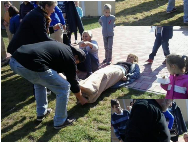
Éz az igazi zsákolás.