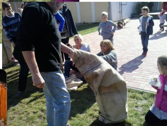
Hát ez meg mi?