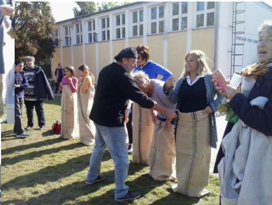
Mi van a zsákodban?