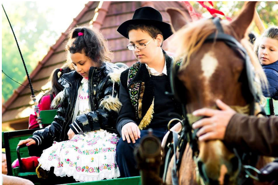
ZSÁNERKÉP CÍMMEL • ÖKOSZÜRET 2016