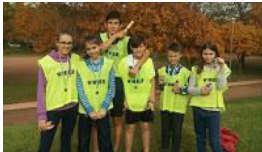
Iskolánk csapata a kerületünk iskolák közötti váltófutó 1956.évi forradalom 60. évfordulójának tiszteletére rendezett versenyen